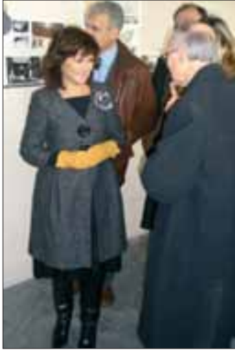
La ministra de Cultura, Carmen Calvo, visitó la segunda fase de las obras de rehabilitación del Archivo General de Simancas.