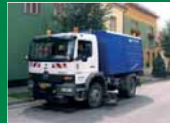
Barredora sobre camión para barridos de calzada en Brno, la segunda ciudad de la República Checa.

Tanto ASA como Alpine son plataformas de desarrollo de FCC hacia los países del Este de Europa, con gran potencial de crecimiento en los próximos años.