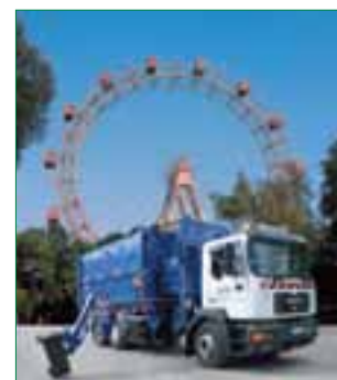
A la izquierda, imagen de la ciudad de Zistersdorf, rodeada de viñedos. Sobre estas líneas, uno de los vehículos propiedad de ASA.

Con sede en Himberg, cerca de Viena, ASA es líder en servicios integrales de gestión y