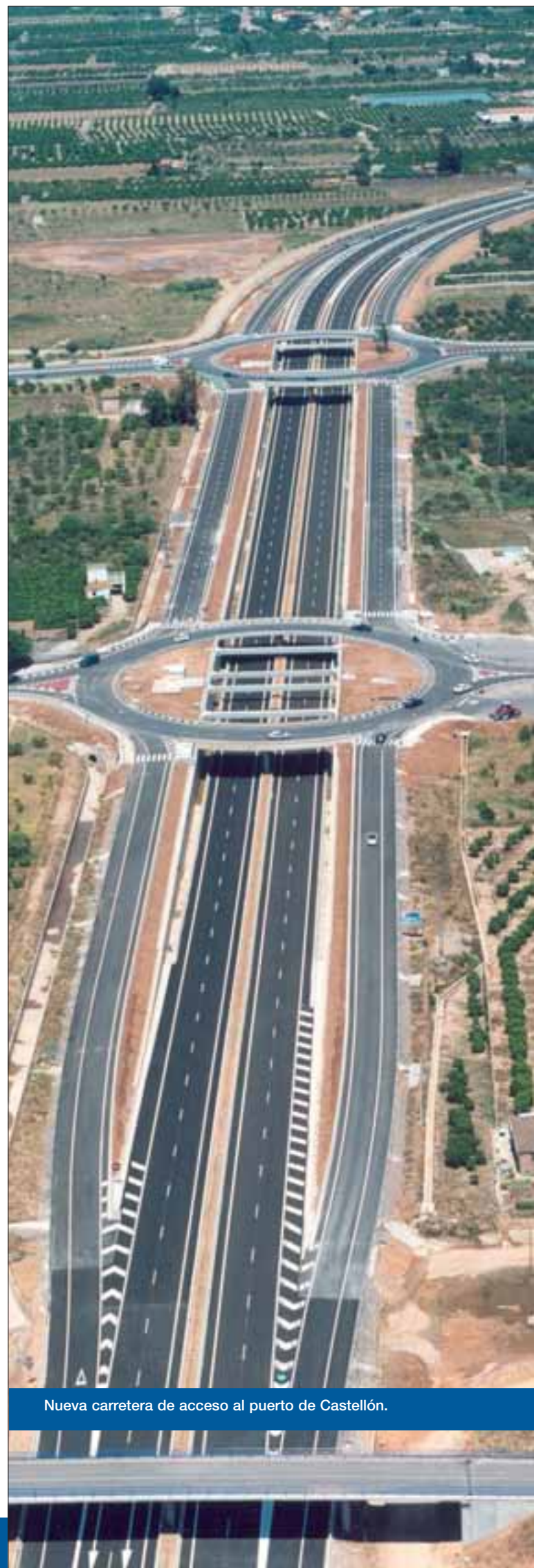
Nueva carretera de acceso al puerto de Castellón.

La obra ha incluido la restauración ambiental del entorno con el fin de disminuir su impacto e integrarla, en todo lo posible, dentro de la zona atravesada, ajustándose a las prescripciones de la Declaración de Impacto Ambiental. Entre las principales medidas ambientales se encuentran la integración paisajística de la obra, la protección del patrimonio arqueológico y la protección acústica del entorno.