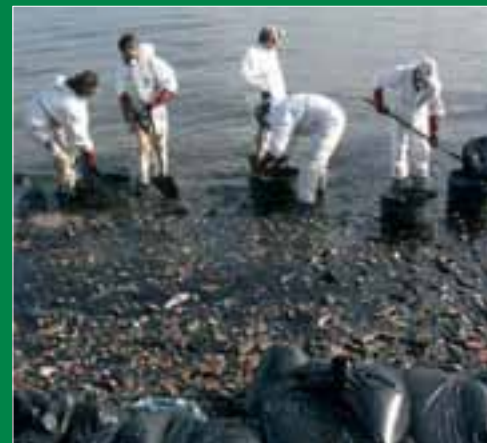
Una brigada de limpieza opera en la zona afectada por el vertido del buque.