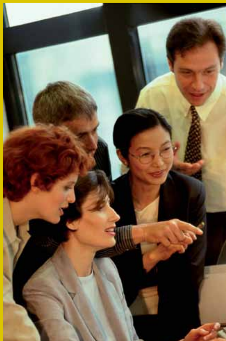
La nueva web dispone de un grado de accesibilidad doble AA.