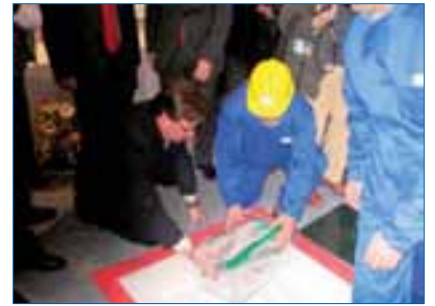
El hospital se construirá en un solar de 145.840 m 2 de superficie.

El hospital contará también con unidades de soporte asistencial: atención al usuario, locales para pacientes y familiares, cafeterías y hotel de pacientes, así como con unidades de investigación y docencia