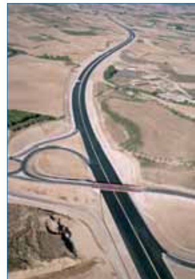
Autovía del Camino, uno de los proyectos de mayor envergadura adjudicado en la historia de la Comunidad Foral de Navarra.

Global Vía nace con la idea de ganar tamaño rápidamente y la vocación de ser uno de los primeros grupos concesionales del mundo, para lo cual, además de las infraestructuras que aportan las dos sociedades matrices, se presentará a todos los concursos destacados que se convoquen en Europa y América del Norte.