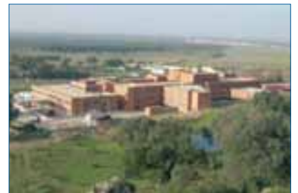
La reforma ha duplicado la superficie útil del centro hospitalario.

Las obras han duplicado la superficie del centro. En total se han ampliado más de 6.000 m 2 y reformado cerca de 2.000. Entre otras mejoras se ha dotado al centro de nuevos servicios hospitalarios, así como de 77 habitaciones individuales, nuevas consultas médicas, zonas de hospitalización, hospital de día, quirófano y nueva central de esterilización.