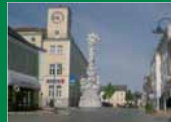
Calle principal de Zistersdorf, localidad situada a unos 60 kilómetros al noroeste de Viena. Abajo, a la izquierda, esquema del proyecto de la incineradora de residuos que construirá FCC en dicha localidad.